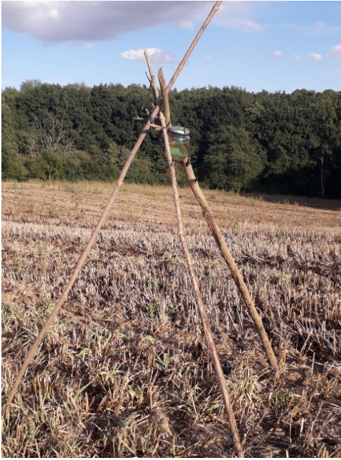
Figure 5: support de pot par trépied