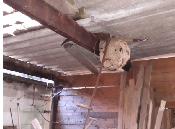
Figure 11: ne pas regarder seulement dans les arbres !

En regardant à travers les jumelles par dessus la ferme et les écuries, j'ai vu des frelons entrer dans un hangar. Lorsque j'ai sonné à la porte, il s'est avéré que les résidents connaissaient le nid depuis plusieurs semaines. Dans ce cas, les frelons ne s'étaient pas déplacés vers la cime des arbres au printemps, mais ont élargi leur nid principal en un grand nid.