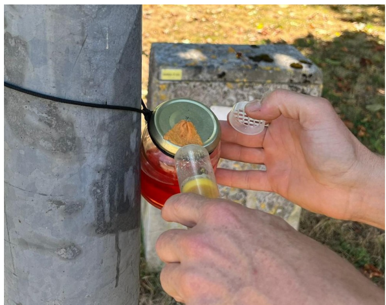
Figure 3: libération d'un frelon sur un pot à mèche

La mesure du temps de vol qui donne la distance au nid, n'est réalisée que sur le premier pot. Les déplacements se font ensuite en suivant la direction de vol, de manière à arriver au nid en quelques étapes. De préférence, la distance entre deux emplacements successifs est suffisamment courte pour que le frelon ne s'égaré pas (par exemple, 100 mètres). La première fois qu'un frelon s'envole d'un nouvel emplacement, il réalise des cercles concentriques pour se réorienter afin de regagner son nid. La direction de vol ne doit pas être prise en compte lors de ces vols d'orientation car elle n'est généralement pas fiable.