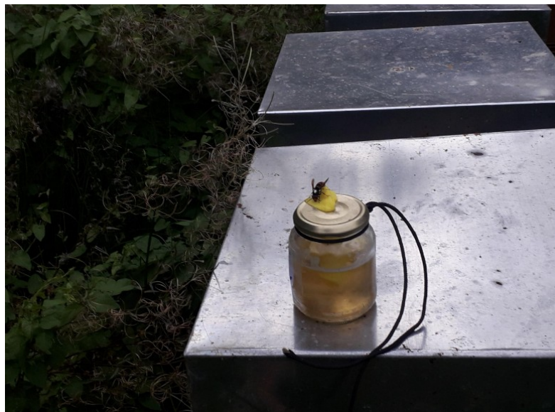
Figure 4: Pot à mèche posé sur une ruche

• Si vous avez des frelons asiatiques autour de vos ruches, ne l'ignorez pas et n'attendez pas que quelqu'un d'autre résolve le problème. Ne les tuez pas, mais cherchez vous-même le nid ! Ce n'est pas si difficile. Fabriquez des pots à mèche simples et surveillez la direction de vol. Utilisez une mèche absorbante solide telle qu'un chiffon de nettoyage (bouilli pour enlever les odeurs), de type Swiffer®, pour que la mèche soit toujours humide (pas de mouchoir, de t-shirt ou d'essuie-tout). Ne faites pas le trou dans le couvercle trop grand sous