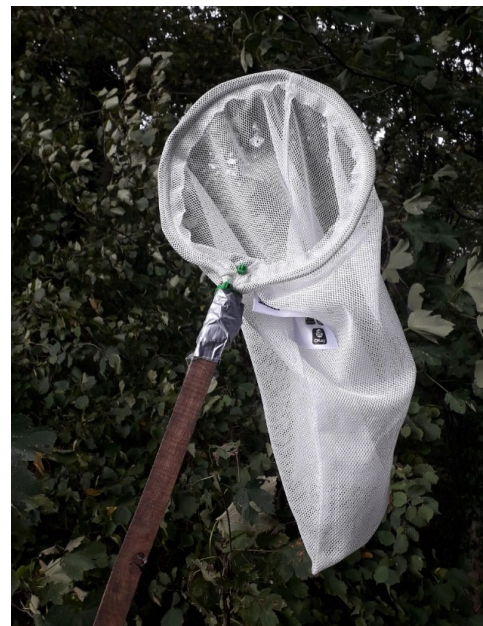
Figure 6: Filet à papillons réalisé avec un sac à légumes

• Avec 2 ou 3 pots à mèche accrochés l'un au-dessus de l'autre, le frelon asiatique a plus de chances de boire tranquillement lorsque ces "ennuyeux" frelons européens sont à proximité.