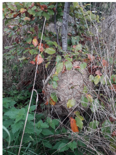
Figure 9: nid caché au ras du sol

• Ne vous contentez pas de regarder les arbres ! Les nids primaires et secondaires peuvent être trouvés n'importe où, y compris au sol (figure 9), dans les ronces, les haies, les arbustes, les toits, les corniches, les murs, les écuries, les nichoirs, etc. Si vous trouvez un nid primaire actif, recherchez également un nid secondaire. à proximité, généralement à moins de 50 mètres, ou un peu plus loin.