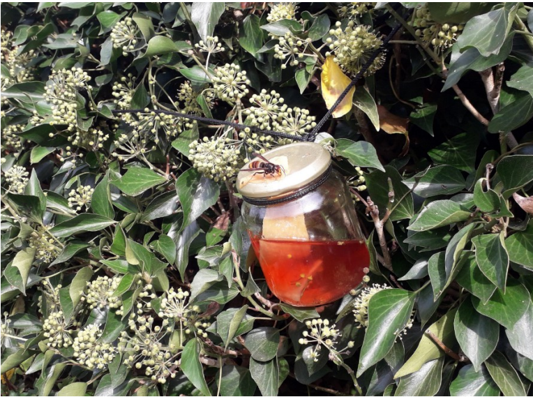
Figure 7: Pot à mèche avec frelon dans du lierre

• Lorsque le lierre commence à fleurir, il suffit de chercher des lierres en fleurs (arbustes, haies) dans les environs pour déceler la présence de frelons asiatiques. Ils viennent au nectar et y chassent également les insectes. Si vous voulez chercher un nid en automne, cherchez d'abord le lierre en fleurs. Accrochez vos pots à mèche dans le lierre (figure 7), les frelons trouveront ces pots plus rapidement que les pots suspendus au hasard.