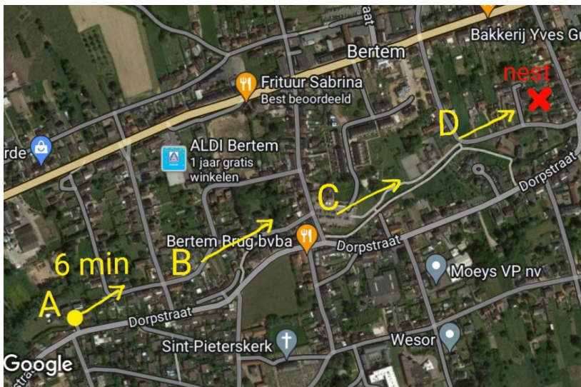
Figure 2: en trois déplacements jusqu'au nid

Par la méthode avec déplacement du frelon, il est possible de progresser rapidement et de trouver le nid avec seulement un frelon et deux pots à mèche. Le suivi est également beaucoup plus rapide que si vous déplacez vos pots et attendez ensuite à chaque fois un jour ou plus pour que les frelons les trouvent.