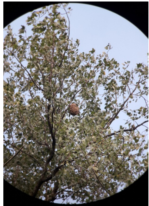
Figure 8: nid à travers des jumelles

• Faites une capture d'écran sur Google Maps et dessinez-y les directions et les distances de vol. Cela clarifiera l'endroit où vous devez chercher. Les directions de vol et les emplacements des pots à mèche peuvent également être dessinés et partagés dans cette application : http://isabovzw.com/apps/ . De cette façon, tout le monde peut facilement collaborer pour trouver des nids. Vous trouverez également des URL vers des groupes Whatsapp régionaux. Si vous savez approximativement où se trouve le nid, regardez d'abord calmement au-dessus de la cime des arbres avec vos jumelles. Souvent, vous voyez des frelons volants au-dessus d'un arbre. Le nid lui-même est généralement mieux vu de loin et parfois d'un seul endroit. Vous pouvez marcher en décrivant un grand cercle autour de l'arbre et scanner à nouveau l'arbre tous les quelques mètres.